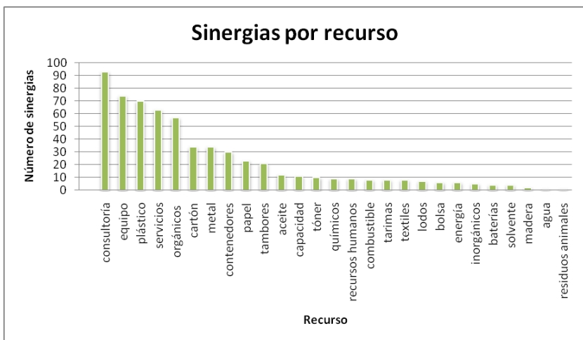
Gráfico 1. Sinergias por recurso 4to taller