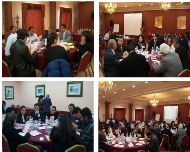
Participantes durante la sesión de trabajo en el Cuarto Taller de Simbiosis Industrial

Una vez concluida la dinámica y presentados los resultados, los asistentes al taller manifestaron sus opiniones e inquietudes respecto al mismo, las cuales serán tomadas en cuenta por el Equipo NISP para el manejo del programa y futuros eventos.